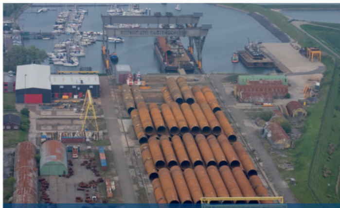
Kamps Kats, Veerhaven 2, 4485 PL Kats

Hoofdkantoor Kamps Heinkenszand Schouwersweg 82 4451 HT Heinkenszand