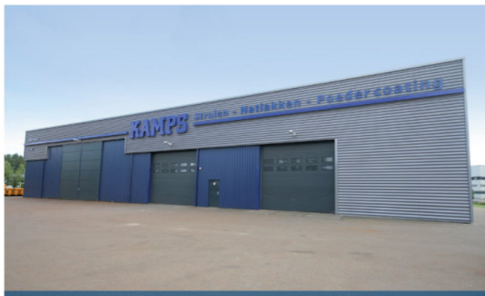
Kamps Heinkenszand, Schouwersweg 82, 4451 HT Heinkenszand