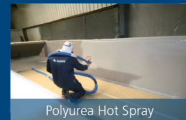
Polyurea Hot Spray